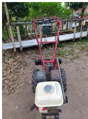
Gambar 4. Hasil Perancangan Pada Traktor

Servo diputar melalui PWM modul penerima. Salah satu sensor pada traktor adalah sensor ultrasonik yang dipasang di depannya dan berfungsi sebagai pendeteksi jarak. Jika traktor di remote akan membunyikan alarm ( buzzer ). Mikrokontroler Arduino Uno ATmega 328p bertugas mengontrol sistem kerja sensor yang meliputi inialisasi program, pembacaan, pemrosesan, dan penyimpanan data (Purnomo, 2019).