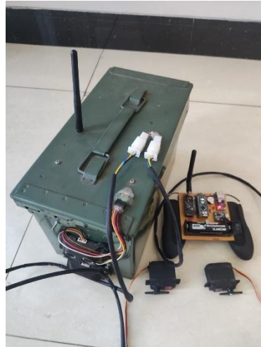
Gambar 3. Prototipe Pengendali Traktor

Salah satu sensor pada traktor adalah sensor ultrasonik yang dipasang di depannya dan berfungsi sebagai pendeteksi jarak (Saparno, 2008) . Jika traktor di remote akan membunyikan alarm ( buzzer ). Mikrokontroler Arduino Uno ATmega 328p bertugas mengontrol sistem kerja sensor yang meliputi inialisasi program, pembacaan, pemrosesan, dan penyimpanan data (Sidauruk, 2011).