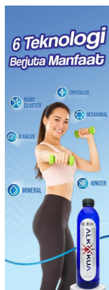
Gambar 3. Visualisasi layout desain produk alkakua pada media xbanner

Spanduk dirancang untuk menarik perhatian dalam lingkungan luar ruang, seperti event olahraga dan kegiatan promosi lainnya. Desainnya memanfaatkan komposisi yang kuat dengan elemen fotografi yang menampilkan aktivitas keseharian pengguna Alkakua. Berdasarkan teori komunikasi visual, penggunaan citra yang relevan dengan pengalaman pengguna dapat meningkatkan keterlibatan audiens dan memperkuat identitas merek [30] [9].