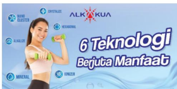
Gambar 4. Visualisasi layout produk alkakua pada media spanduk

Spanduk dirancang untuk menarik perhatian dalam lingkungan luar ruang, seperti event olahraga dan kegiatan promosi lainnya. Desainnya memanfaatkan komposisi yang kuat dengan elemen fotografi yang menampilkan aktivitas keseharian pengguna Alkakua. Berdasarkan teori komunikasi visual, penggunaan citra yang relevan dengan pengalaman pengguna dapat meningkatkan keterlibatan audiens dan memperkuat identitas merek [30] [9].