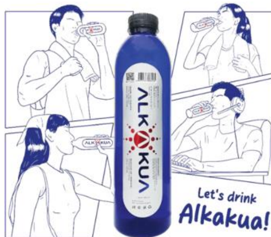
Gambar 6. Visualisasi layout pada media merchandise goddy bag produk Alkakua

Merchandise seperti tote bag dan botol minum dirancang untuk meningkatkan interaksi konsumen dengan merek Alkakua. Penggunaan desain ilustratif yang simpel dan warna yang sesuai dengan identitas merek bertujuan untuk menciptakan daya tarik yang lebih tinggi di kalangan generasi muda. Studi jurnal menunjukkan bahwa strategi pemasaran berbasis merchandise dapat meningkatkan loyalitas pelanggan dan memperluas jangkauan merek melalui distribusi produk yang dapat digunakan dalam kehidupan sehari-hari[32].