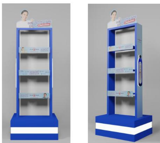
Gambar 5. Visualisasi layout produk Alkakua pada media Display Rak( Sumber: diolah oleh Edy Chandra, 2025).

Display rak didesain sebagai media promosi yang ditempatkan di titik penjualan strategis. Rak ini tidak hanya berfungsi sebagai tempat penyimpanan produk tetapi juga sebagai alat branding yang menarik perhatian calon pembeli. Desain rak memanfaatkan konsep point-of-purchase advertising , di mana warna, bentuk, dan pencahayaan digunakan untuk mengoptimalkan visibilitas produk di dalam toko[31].