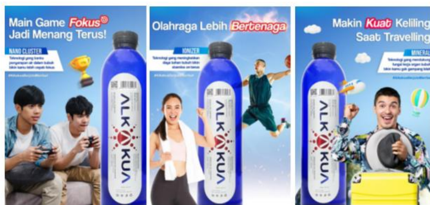
Gambar 2. 3(tiga) varian tampilan desain visual poster produk alkakua

Poster didesain untuk memberikan informasi singkat dan jelas mengenai manfaat teknologi nano hexagonal yang digunakan dalam Alkakua. Desain layout menyajikan nuansa biru dengan komposisi foto produk & model figure olahragawan yang besar, dan tipografi yang mudah dibaca. Strategi visual ini sejalan dengan penelitian [28] yang menyatakan bahwa pemilihan warna dan elemen desain yang tepat dapat meningkatkan daya tarik visual dan efektivitas pesan dalam pemasaran.