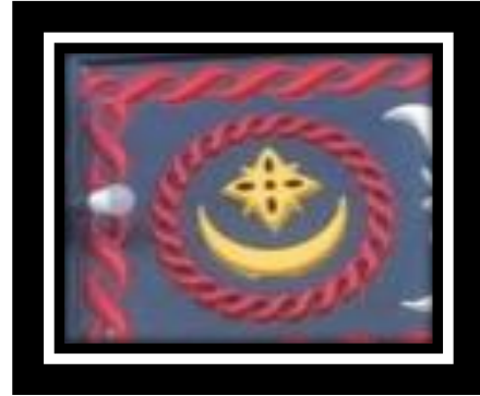
Gambar 10. Motif Bulen Bintang

Bentuk motif bulen bintang seperti bulan sabit dan bintang yang dikelilingi motif puter tali , Motif ini merupakan perwujudan dari alam semesta.