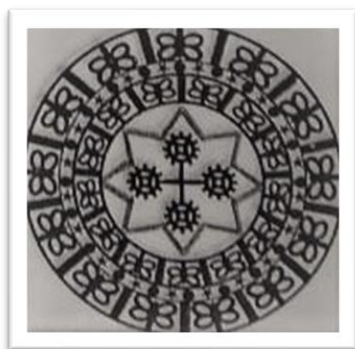
Gambar 2. Ulen-Ulen