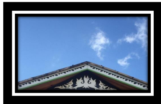
Gambar 7. Motif Pucuk Ni Tuwis

Pucuk Ni Tuwis dalam Bahasa Indonesia berarti rebung yang merupakan cikal bakal bambu, Pucuk Ni Tuwis merupakan motif yang memiliki pola menyerupai piramida atau segitiga, motif ini juga disebut motif tumpal