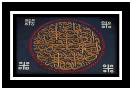
Gambar 9. Motif Tekukur

Bentuk ornamen Tekukur terdiri dari susunan empat lingkaran berwarna putih yang dipisah oleh garis silang horizontal. motif tekukur menjadi pembatas di bagian samping kiri, kanan, atas dan bawah di tengah terletak motif kaligrafi berukuran besar melingkar yang di kelilingi oleh motif puter tali .