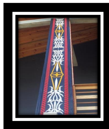
Gambar 5. Motif Emun Berangkat (Awan Berarak)

Bentuk Emun Berangkat atau yang disebut ( awan berarak ) memiliki garis melengkung dengan liukkan di bagian ujung kemudian memiliki empat atau lima cabang lengkungan tajam. Motif Emun Berangkat merupakan representasi dari awan yang senantiasa hadir silih berganti dalam bentuk gumpalan dinamis, selalu bergerak dan berubah bentuk, motif ini dipadukan dengan motif bintang yang memiliki bentuk sebuah bintang di dalam lingkaran yang memiliki dua buah segitiga dibagian atas dan bawah yang menjadi penghubung antara motif satu dengan yang lain selanjutnya motif Emun Berangkat dipadukan dengan motif puter