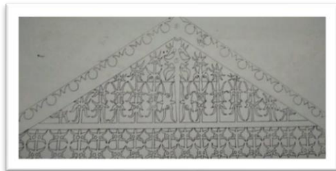
Gambar 1. Emun Berangkat