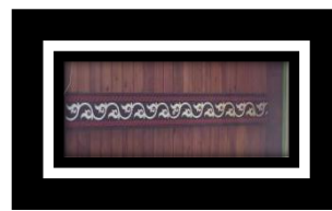
Gambar 8. Motif Emun Beriring

Bentuk Emun Beriring yang terdapat pada rumah Adat Pitu Ruang berbentuk sulur-sulur yang