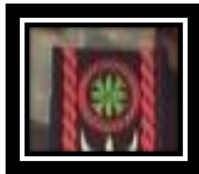
Gambar 11. Motif ulen-ulen

Motif ulen-ulen merupakan representasi dari bulan yang merupakan simbol kekuatan dan memberi penerangan pada dunia. Pola motif ulen-ulen biasanya memiliki komposisi motif dalam wujud suatu desain geometris dengan pola memancar, apabila motif ulen-ulen terdapat pada