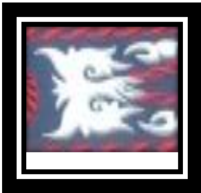
Gambar 12. Bunga Ni TerpuK

Bentuk dari bunge ni terpuK merupakan stilasi dari tumbuh-tumbuhan yang memiliki pelepah mirip tanaman pisang-pisangan, membentuk rimpang, Bunge ni terpuK merupakan bunga kuncung yang tengah mekar.