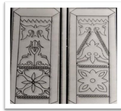
Gambar 3. Mutik (putik)

Kerawang terdiri dari beberapa motif memiliki bentuk dan fungsi penempatan yang berbeda salah satunya Kerawang diterapkan pada rumah adat Gayo dalam bentuk ukiran.