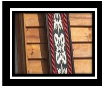
Gambar 13. Bunga kemang

Bentuk ornamen bunge kemang yang terdapat pada rumah adat Pitu Ruang merupakan stilasi dari bunga yang sedang mekar, yang memiliki empat kelopak bunga dan di bagian tengah terdapat putik bunga, motif ini di padukan dengan motif puter tali dan motif emun berangkat .