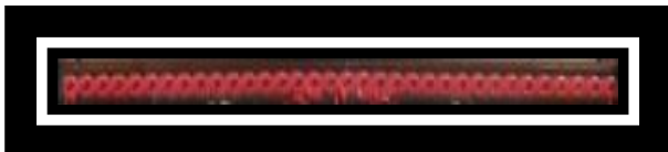
Gambar 6. Motif Putar Tali

Bentuk puter tali Sebuah tali terdiri dari pangkal dan sebuah ujung, tali yang terbentuk dari jalinan bahan tertentu, sebuah tali berbentuk dasar memanjang dan lurus yang berulang-ulang. Motif puter tali biasa dipadukan dengan semua motif karena motif puter tali merupakan motif pelengkap.