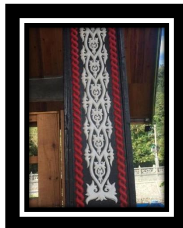
Gambar 14. Emun Berkune