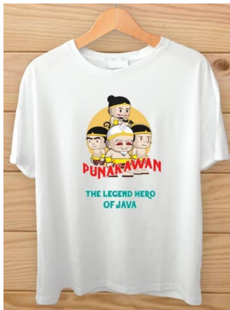
Gambar 5. Breakdown Dari Karakter Wayang Punokawan