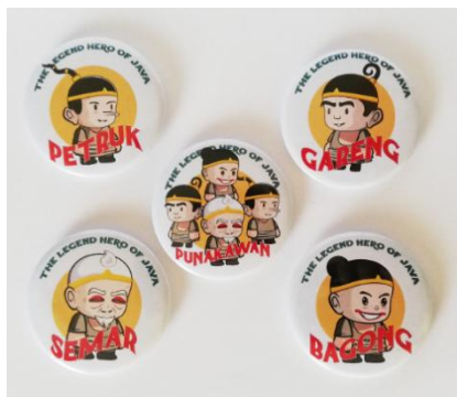
Gambar 6. Breakdown Dari Karakter Wayang Punokawan