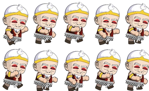
Gambar 4. Sprite berlari